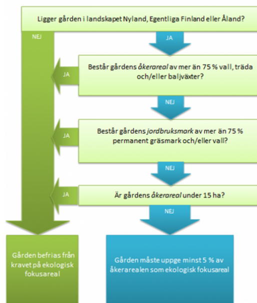
Bild 3. Villkoren för ekologisk fokusareal