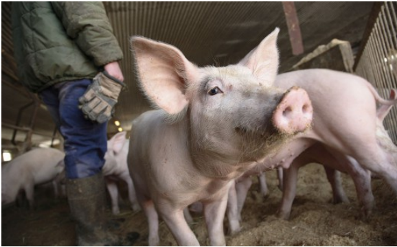
Kuva 22:

Sikojen, nautaeläinten sekä lammas- ja vuohieläinten pitäjien on