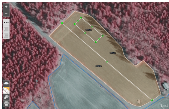
Ritande av jordbruksskiftet i Viputjänsten

Ritandet av jordbruksskiften är en del av stödansökan. Rita in jordbruksskiftena om det finns fler än ett jordbruksskifte på ditt basskifte. Genom ritandet bildas den areal för ett jordbruksskifte som används vid ansökan om stöd, kontroll och betalning av stödet. Du behöver rita in bara sådana jordbruksskiftesgränser som inte är gränser för basskiftet. Basskiftets areal ska vara lika stor som jordbruksskiftenas sammanlagda areal.