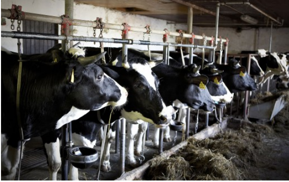
Kuva 17: Kuva: Plugi