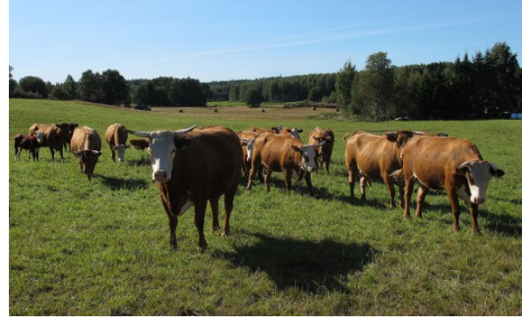
Kuva 19: