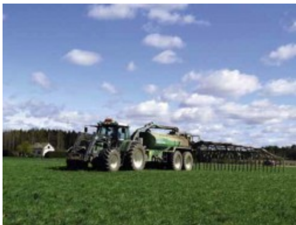
Kuva 10:

Levitä lannoitteet pellolle siten, että valumia vesiin ei tapahdu eikä pohjamaa tiivisty. Ota lannoituksessa huomioon keskimääräinen satotaso, viljelyvyöhyke, kasvinvuorotus ja maalaji. Älä levitä lannoitteita koskaan lumipeitteeseen tai routaantuneeseen eikä veden kyllästämään maahan.