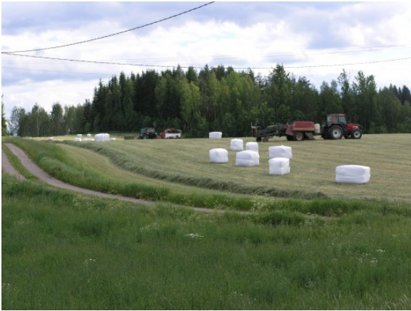
Kuva 3: