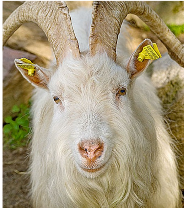
Kuva 29:

Muiden tuotantoeläinten (mm. hevoset, bii-sonit, tarhatut peurat, strutsieläimet, ankat, myskisorsat, hanhet, kalkkunat, turkiseläimet, broilerit, tarhatut riistaeläimet, viiriäiset, kanit, tarhatut porot) osalta täydentävien ehtojen tarkastuksissa valvotaan esimerkiksi juottoa ja ruokintaa koskevia vaatimuksia, pitopaikan tila- ja olosuhdevaatimuksia, mm. valaistusta, rakennusten ja laitteiden materiaaleja ja pitopaikan turvallisuutta. Lisäksi valvotaan, eläinten hyvinvoinnin tarkastamista, sairaista ja loukkaantuneista eläimistä huolehtimista, ulkotarhan vaatimuksia sekä eläinten suojaamista epäsuotuisilta sääolosuhteilta asianmukaisesti ja kuolleista eläimistä pidettävää kirjanpitoa. Yksityiskohtaisemmin vaatimukset on esitelty liitteessä 2 49 .