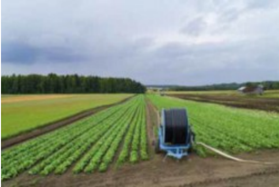
Kuva 6:

Kun käytät vettä maatalousmaan kasteluun,