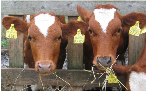
Kuva 28:

Tarkastuksissa valvotaan kaikkien eläinlajien osalta juottoa ja ruokintaa koskevia vaatimuksia mukaan lukien automaattisten ruokinta- ja juottolaitteistojen käyttö ja tarkastaminen, pitopaikan tila- ja olosuhdevaatimuksia, mm. valaistusta, rakennusten ja laitteiden materiaaleja ja pitopaikan turvallisuutta. Lisäksi valvotaan, eläinten hyvinvoinnin tarkastamista, sairaista ja loukkaantuneista eläimistä huolehtimista, ulkotarhan vaatimuksia ja eläinten suojaamista epäsuotuisilta sääolosuhteilta asianmukaisesti sekä kuolleista eläimistä pidettävää kirjanpitoa. Uutena valvontakohteena on vaatimus eläintenpitäjän pätevyydestä.