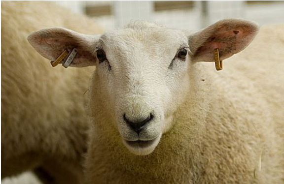
Kuva 25:

TSE eli tarttuva sienimäinen aivorappautus (transmissible spongiform encephalopathy) on kokoomanimi usealle, eri eläinlajeilla esiintyvälle samankaltaiselle taudille. Tunnetuimmat eläimillä esiintyvät TSE -taudit ovat nautojen BSE ja lampaiden ja vuohien scrapie.