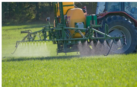
Kuva 11:

Kasvinsuojeluaineita on käytettävä asianmukaisesti ottaen huomioon hyvän kasvinsuojelukäytännön periaatteet. Kasvinsuojeluaineiden voimassaoleviin käyttöohjeisiin tulee perehtyä ja niitä on noudatettava. Kasvinsuojeluaineiden käytöstä on tehtävä muistiinpanot.