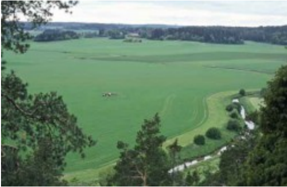
Kuva 7:

Pohjaveden kaikenlainen pilaaminen on kielletty ympäristönsuojelulain (527/2014). Ympäristölle vaarallisten ja haitallisten aineiden päästäminen suoraan tai välillisesti pohjaveteen on kielletty valtioneuvoston asetuksella 1022/2006. Ympäristölle vaaralliset ja haitalliset aineet, joita ei saa päästää suoraan tai välillisesti pohjaveteen on lueteltu taulukossa 4. Viljelijän on oman tilansa osalta huolehdittava, ettei tilan toiminnasta aiheudu edellä mainitun asetuksen (1022/2006) liitteessä E mainittujen ympäristölle vaarallisten ja haitallisten aineiden suoria tai epäsuoria päästöjä pohjaveteen (esim. polttoaineista, voiteluaineista, kasvinsuojeluaineista). Huomioi vaatimus kaikessa tilasi maataloustoiminnassa ja koko maatalousmaalla, myös niillä alueilla, jotka eivät sijaitse pohjavesialueella. Ympäristölle vaaralliset ja haitalliset aineet, joita ei saa päästää suoraan tai välillisesti pohjaveteen on lueteltu taulukossa 4.