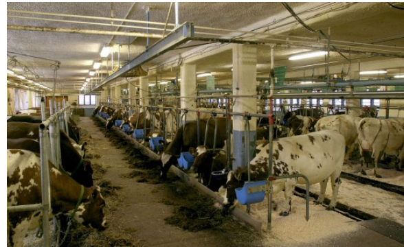
Kuva 18:

Alkutuotantopaikka on rakennettava ja hoidettava niin, ettei siellä tuotettavien ja käsiteltävien elintarvikkeiden turvallisuus vaarannu. Tuotteiden suojaamiseksi saastumiselta rehun lisäaineita, eläinlääkkeitä, kasvinsuojeluaineita, lannoitevalmisteita, biosidejä, kuten jyrsijämyrkyjä ja desinfiointiaineita, ja muita vaarallisia kemikaaleja sekä jätteitä on käsiteltävä, varastoitava ja käytettävä oikein.