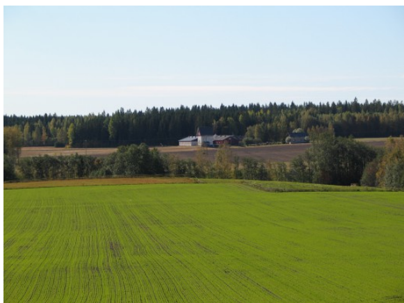
Kuva 1:

Ehtojen noudattamista valvotaan tilakäynneillä tehtävillä tarkastuksilla. Tarkastus voidaan tehdä myös esimerkiksi sellaisilla tiloilla, joilla on jonkin muun valvonnan yhteydessä havaittu täydentävien ehtojen laiminlyönti. Tarkastuksissa havaitut täydentävien ehtojen laiminlyönnit vähentävät samanaikaisesti kaikkien tukien määrää, joiden ehtona täydentävien ehtojen noudattaminen on.