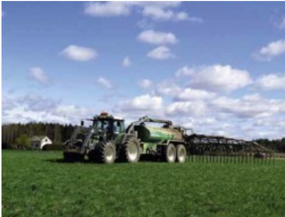
Kuva 8: