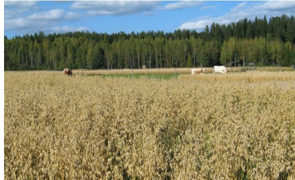
Kuva 15:

neuvot, rehun käsittely- ja ruokintalaitteistot tulee puhdistaa, jotta vältetään seuraavan rehu-erän saastuminen.