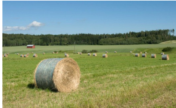
Kuva 16:

Lisätietoja entisten elintarvikkeiden rehukäytöstä 31 löytyy myös Ruokaviraston internetsivuilta.