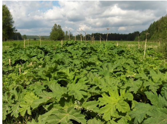
Kuva 4: Armenian jättiputki (Heracleum sosnowskyi)

aloja koskeva kasvinsuojeluaineiden käyttökielto viherryttämistuen ehtojen mukaisesti. Viherryttämistuen ehdoista voit lukea hakupöytäkirjasta.