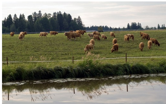
Kuva 27:

maan täydentävien ehtojen vaatimusten osalta. Käytännössä tilalla käyvä eläinsuojeluviranomainen on yleisimmin kunnaneläinlääkäri, mutta täydentävien ehtojen laajennuksen tekee läänineläinlääkäri.