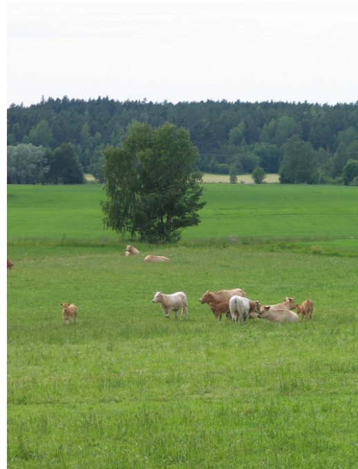
Kuva 2:

Oppaassa ei ole ehtomuutoksia vuodelle 2020. Vuodelle 2020 tehdyt muutokset ovat vuosilukumuutoksia, muita täsmennyksiä sekä linkkien päivityksiä.