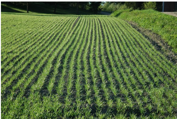
Kuva 5:

Jos olet ilmoittanut kasvulohkon viherryttämistuessa ekologiseen ala-tyypensitojakasvien alaksi, ota huomioon näitä aloja koskeva kasvinsuojeluaineiden käyttökielto viherryttämistuen ehtojen mukaisesti. Viherryttämistuen ehdoista voit lukea hakuoppaasta.