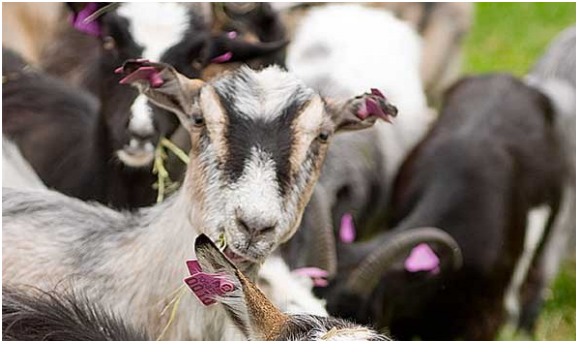
Kuva 23:

Eläinlajikohtaisiin ohjeisiin on kerättyä sekä EU- lainsäädännöstä että kansallisesta lainsäädännöstä johtuvat eläinten merkitsemis-