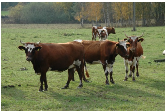
Kuva 9:

Lannan ja lannoitevalmisteiden sisältämät ravinteet voivat pilata pinta- ja pohjavesiä. Siksi lannan käytölle ja varastoinnille sekä muiden maataloudessa lannoitteina käytettävien aineiden käytölle on rajoituksia, jotka perustuvat valtioneuvoston asetukseen (1250/2014) eräiden maa- ja puutarhataloudesta peräisin olevien päästöjen rajoittamisesta. Rajoitukset koskevat kaikkia viljelijöitä.